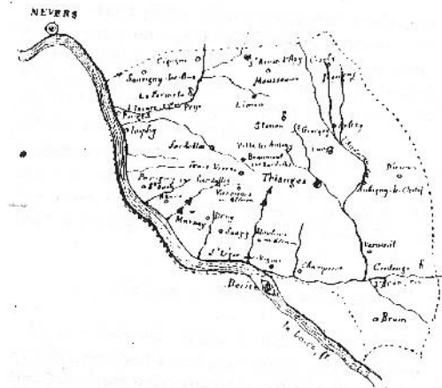
L'ARCHIPRÊTRE DE THIANGES d'après la Carte de l'ancien Diocèse de Nevers, dressée par M r CHASSIN, et reproduite à la fin du volume des Atlas de Nevers.

Voor het eerst gebeurde dat trouwens in Marzy (vlakbij Nevers) en Écots (tussen Thianges en la Machine in).